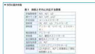
「酵素検査の概説」図表示画面

<南江堂> 概説と検査解説を臨床に即した分類で構成した好評書。「主要病態の検査」から必要な検査項目がすぐに検索可能。検査解説では「検査の基準値・目的」「異常値を示す疾患・病態」「保険点数」などの情報が一目でわかる。臨床に活かせる「判読のポイント」も充実。 ※電子化にあたり、一部書籍と異なる記載があります。また一部の図・表・付録は収録されておりません。 【収録数:見出し語約790項目/キーワード約1,000項目/約300図】